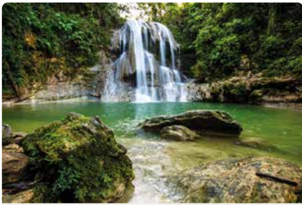
El Yunque National Park