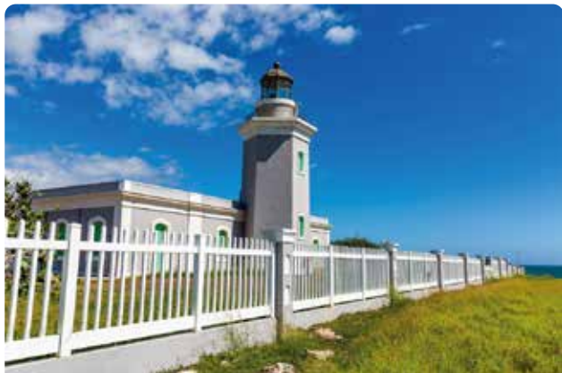
Faro de los Morrillos

Seguiréis bordeando la isla por el oeste hasta alcanzar Cabo Rojo, conocido como el "Pueblo de Cofresí", un nombre que alude al famoso pirata puertorriqueño Roberto Cofresí y Ramírez de Arellano. Se trata de una joya costera por los espectaculares paisajes y las playas protegidas del Refugio Nacional de Vida Silvestre de Cabo Rojo. Entre las muchas atracciones espectaculares de Cabo Rojo se encuentra el faro de Los Morrillos, un elegante edificio neoclásico con ventanas verdes rodeadas de impresionantes acantilados y una vista panorámica del mar Caribe. Igualmente la zona está salpicada de varias playas increíbles de arena blanca y aguas tranquilas y cristalinas con un increíble ambiente tropical. Alojamiento.