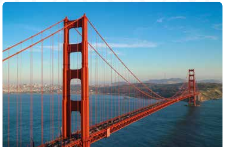
Golden Gate Bridge

Día destinado a conocer San Francisco, una de las ciudades más bonitas de los Estados Unidos. Os recomendamos visitar las bonitas colinas del barrio de Presidio, el histórico muelle de Fisherman's Wharf con su colonia de leones marinos, el archifamoso puente Golden Gate y las zonas céntricas de Union Square y Chinatown. Además tampoco deberíais dejar de realizar un cruceo por la bahía pasando por la mundialmente famosa isla de Alcatraz. Alojamiento.