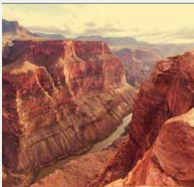
P.N. Gran Cañón

Tras disfrutar del espectacular juego de luces y sombras del amanecer sobre el Gran Cañón emprenderéis la marcha hacia Las Vegas, retomando la ruta 66 y pudiendo disfrutar de uno de los tramos originales y más característicos de la ruta entre Seligman y la población minera de Kingman, en las proximidades de la “pistolera” Oatman. Por último, antes de llegar a Las Vegas, ya en el estado de Nevada podéis admirar la presa Hoover, una de las principales construcciones de ingeniería de todo el país. Llegada a Las Vegas, capital mundial del entretenimiento con múltiples espectáculos de todos los estilos en los distintos hoteles y casinos del “Strip”, la famosa avenida que nunca duerme, desde los juegos de luces de la ciudad, las espectaculares fuentes de agua del hotel Bellagio o el barco pirata de la Treasure Island (isla del tesoro) hasta la majestuosidad de París o Venecia y los volcanes en erupción del Mirage. Alojamiento.