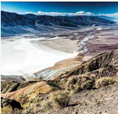
P.N. Death Valley

Continuación del viaje atravesando los últimos espectaculares paisajes del Valle de la Muerte hasta alcanzar los valles de la vertiente norte de la Sierra Nevada, a través de la cual entrareis en el parque nacional de Yosemite sobrepasando el paso de Tioga, cerrado por la nieve durante los meses invernales. Llegada a Yosemite y alojamiento en el interior del parque.