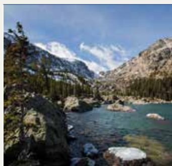
P.N. Rocky Mountains