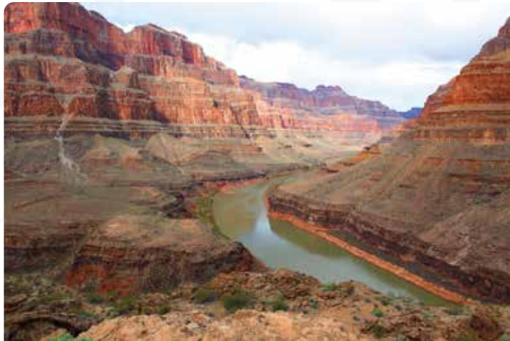
P.N. Gran Cañón

Día entero destinado a explorar en profundidad el parque nacional del Gran Cañón. Podréis recorrer los senderos del "South Rim" con la posibilidad de realizar un trecho del "Bright Angel Trail", el famoso sendero que, en un día de marcha de bajada y otro de subida, llega hasta el fondo del cañón; o el Hermit Trail, el sendero que recorre el borde del cañón propiciando vistas panorámicas realmente impactantes. Igualmente también tendréis la oportunidad de realizar alguno de los sobrevuelos del cañón en helicóptero y os resultará imprescindible admirar la puesta del sol desde alguno de los miradores como el Yaki Point o el Hopi Point. Alojamiento.