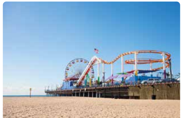
Santa Mónica Pier