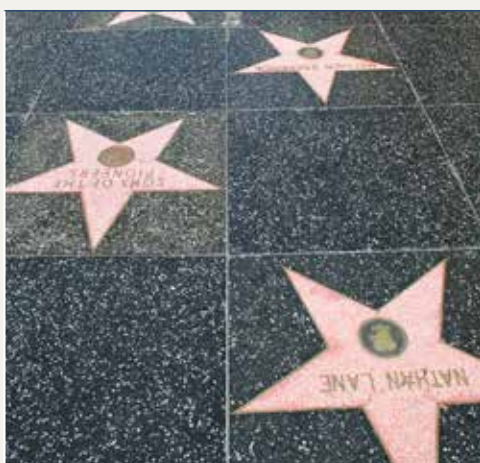
Walk of Fame