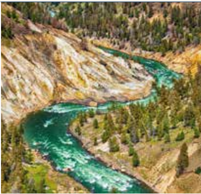
Yellowstone Grand Canyon

Devolución del coche de alquiler y salida en vuelo con destino Jackson, al pie de las montañas rocosas y a poco más de 100 kilómetros de distancia de la entrada sur del parque nacional de Yellowstone. Recogida del coche de alquiler y salida por carretera hacia el norte. Junto al aeropuerto de Jackson Hole se encuentran los límites del parque nacional Grand Teton, de gran belleza paisajística y que destaca por sus lagos y picos con glaciares que adornan sus cumbres, así como por su fauna entre la que destaca la más grande colonia de alces de toda América, que comparte este parque junto con la reserva nacional de alces, justo al sur y con el colindante parque nacional de Yellowstone al norte. Tras recorrer la carretera panorámica que atraviesa Grand Teton, se sale del parque entrando inmediatamente en Yellowstone por su entrada sur. Llegada al hotel elegido y alojamiento.