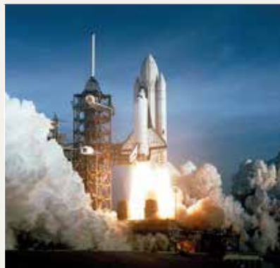
Kennedy Space Center

Recogida del coche de alquiler y salida rumbo a la costa atlántica hasta llegar a Cabo Cañaveral donde se encuentra el Centro Espacial Kennedy desde donde la misión Apolo 11 lanzó a Buzz Aldrin y a Neil Armstrong a la luna. Tras la visita al Kennedy Space Center continuaréis hacia el sur para llegar a Cocoa Beach, un lugar fantástico donde poder relajarnos en la playa frente al mar. Alojamiento.