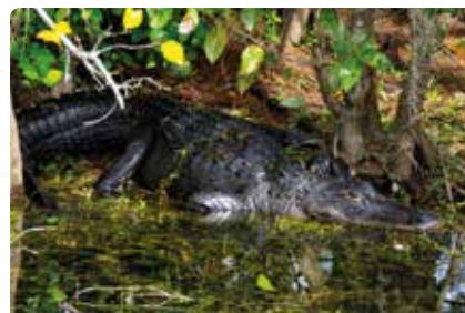
Everglades National Park