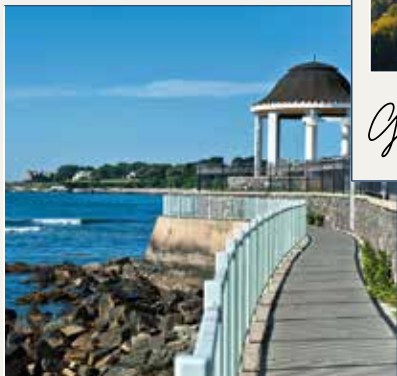
Cliff Walk Newport