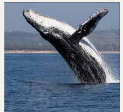
Avistamiento en Nantucket