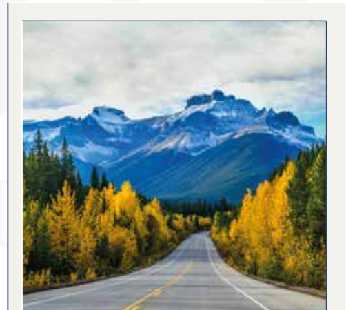
White Mountains N.F.