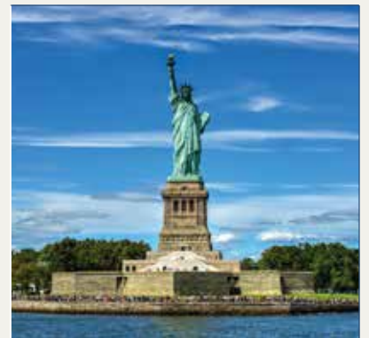
Estadua de la Libertad