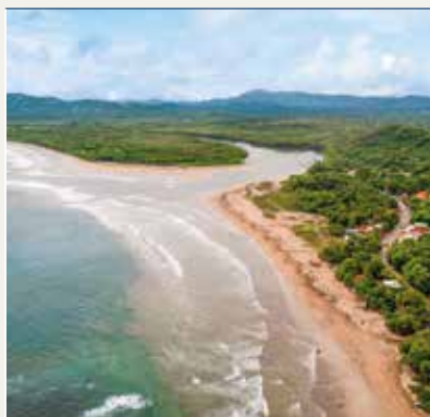
Playa de Tamarindo