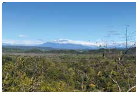
Montañas de Bagaces