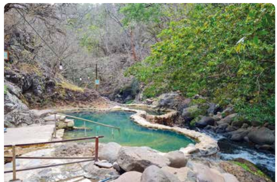
Hot Water Pools