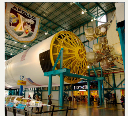
Kennedy Space Center