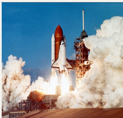
Kennedy Space Center

Seguiréis conduciendo hacia el sur y a pocos km os encontraréis con Daytona Beach, donde se encuentra el Daytona Internacional Speedway, que alberga la celebración de las 24 horas de Daytona, una de las carreras de resistencia más importantes en el mundo. Siguiendo la costa se llega a la localidad de Titusville muy próxima al Kennedy Space Center donde si queréis podéis realizar una visita a este famoso centro espacial. Tras explorar la zona continuaréis hacia en interior hasta llegar a vuestro hotel en Orlando. Alojamiento.