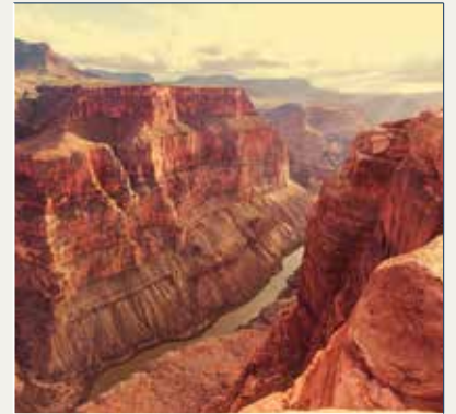
P.N. Gran Cañón