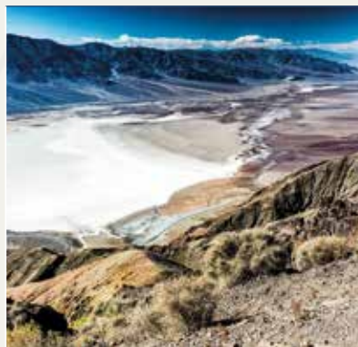
P.N. Death Valley