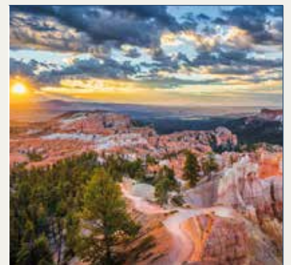
P.N Bryce Canyon