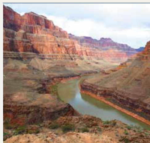
P.N Gran Cañón