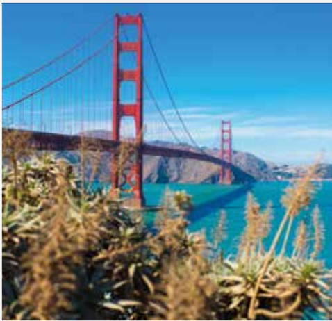
Golden Gate Bridge

Salida de Yosemite atravesando los parajes boscosos del norte de California hasta alcanzar San Francisco, en las costas del Océano Pacífico. Tarde en San Francisco. Alojamiento.