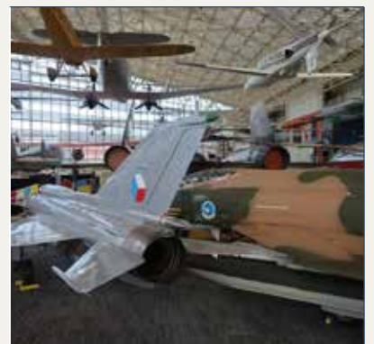
Museo del Aire y del Espacio