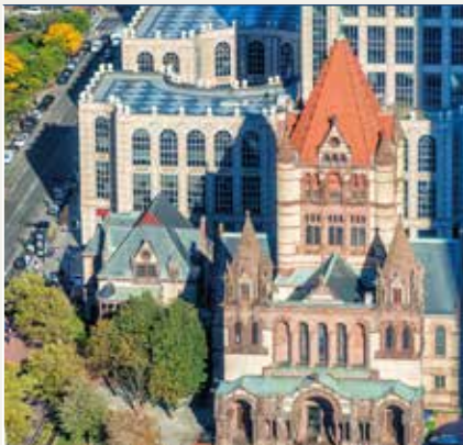
Plaza Copley Square

Salida desde Nueva York, donde iniciaréis vuestro recorrido, a través de Connecticut y Massachusetts, hasta la capital de ésta, Boston, la cuna de la Nación Estadounidense y el lugar donde se fraguó la independencia de los EEUU. Tendréis la oportunidad de disfrutar de un paseo por la Freedom Trail y por el puerto de Boston, teniendo a la vista el famoso "Tea Party", el buque de la armada "Constitution" y Bunkers Hill. Tras una breve parada que haréis para la comida (no incluida) en Quincy Market, disfrutaréis de los Boston Common, uno de los parques más antiguos de EEUU y en cuyo interior se encuentra Public Garden con la hermosa estatua de George Washington. Por último, cruzaréis el río Charles para pasear por las manzanas de las universidades de Cambridge, Harvard y MIT. Cuando caiga la tarde, y a la hora indicada, trayecto de regreso a Nueva York para llegada en torno a las 22h.