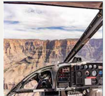
Tour en Helicóptero

Nota: Posibilidad de sustituir la excursión terrestre incluida al West Rim del Gran Cañón por la visita en bus al South Rim, excursiones en avión o helicóptero que sobrevuelan el cañón o incluso aterrizan en el mismo. También existe la posibilidad de hacer la visita en coche de alquiler (450 Kms. de recorrido aprox.) con noche en el Gran Cañón para poder disfrutar de sus maravillosos atardeceres y amaneceres. Consúltanos.