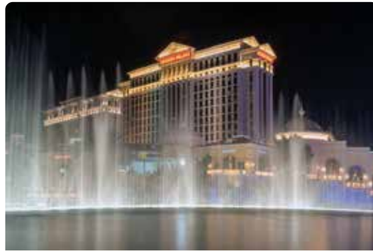
Fuente del Hotel Bellagio

Día libre para disfrutar de la capital mundial del entretenimiento con múltiples espectáculos de todos los estilos en los distintos hoteles y casinos del "Strip". Alojamiento.