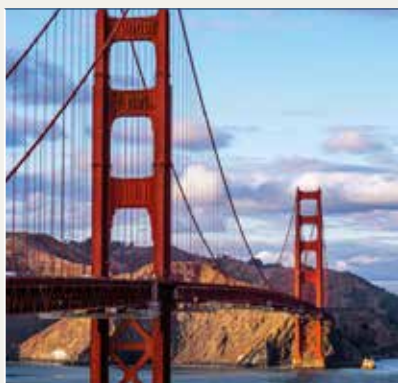
Golden Gate Bridge

Traslado al aeropuerto para tomar el vuelo con destino a San Francisco. Llegada y traslado al hotel elegido y podréis comenzar a disfrutar de la visita panorámica de San Francisco a bordo de los autobuses tipo hop-on hop-off con subidas y bajadas ilimitadas) con los que tendréis la posibilidad de recorrer, durante 48 horas con audioguía en español, todos los rincones de esta maravillosa ciudad. Dispondréis de diferentes rutas de autobuses, que os permitirán conocer los puntos mas atractivos e imperdibles de esta preciosa ciudad como Union Square, el Civic Center, el vibrante barrio de Chinatown, las famosas curvas de la calle Lombard, el muelle de Fisherman's Wharf con todas sus atracciones y los famosos leones marinos, las casas victorianas de Alamo Square, el Golden Gate Park, el famoso mirador Vista Point sobre el puente Golden Gate y recorreréis el legendario puente hasta su extremo norte pudiendo conocer la preciosa villa de Sausalito situada al otro lado de la bahía. Este tour combinado de recorridos en bus podéis utilizarlo como visita panorámica o como medio de transporte durante los días en San Francisco.