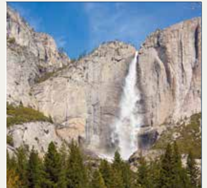
Upper Falls Yosemite