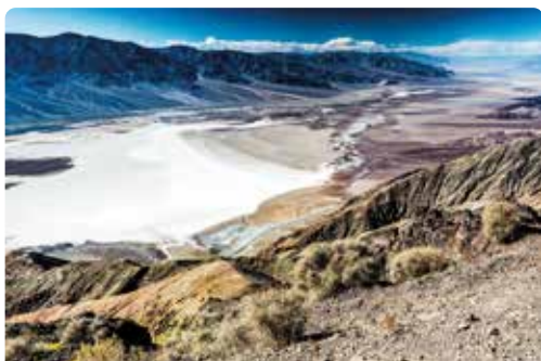
P.N. Death Valley

Recogida del coche de alquiler y salida hacia Yosemite atravesando el parque nacional de Death Valley. Este lugar, el valle de la muerte, es famoso tanto por tener la temperatura más elevada registrada en la tierra como por sus espectaculares paisajes de desierto, que os recomendamos no dejéis de visitar, destacando el mirador de Dante's view, las salinas de Badwater, Zabriskie Point o los distintos campos de dunas. Tras sobrepasar el valle de la muerte se continua por los valles de la vertiente norte de la Sierra Nevada, hasta entrar en el parque nacional de Yosemite a través del paso de Tioga, cerrado por la nieve durante los meses invernales. Llegada a Yosemite y alojamiento.