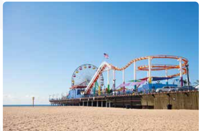
Santa Mónica Pier

Día libre para disfrutar de alguno de los diversos parques temáticos de Los Ángeles como Universal Studios o Disneyland Park o para descansar en las fantásticas playas de Santa Mónica o Venice. Alojamiento.