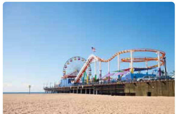
Santa Mónica Pier