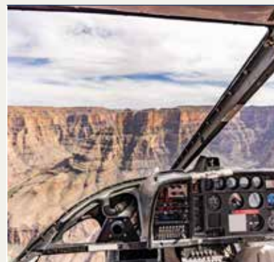
Tour en Helicóptero