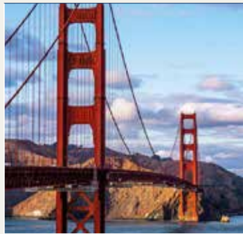
Golden Gate Bridge

Día para seguir disfrutando de San Francisco, donde os incluimos un crucero por la bahía de San Francisco y el puente Golden Gate de 1 hora de duración, divisando los famosos clubs de natación del Aquatic Park, los clásicos veleros de época del Hyde Street Pier, el parque Nacional marítimo de San Francisco y las colinas del barrio de Presidio, hasta alcanzar la fantástica mole de hierro del puente más famoso del mundo, el bello Golden Gate Bridge. En el camino de vuelta se recorren las reservas de vida salvaje de las Marin Headlands y la bonita población de Sausalito, origen de la "generación de las flores" en los años 60 antes de bordear lentamente la legendaria isla de Alcatraz con su famosa prisión. Ya de vuelta se puede admirar el otro gran puente de la bahía, el puente de Oakland y los leones marinos del muelle 39 del Fisherman's Wharf. Igualmente, os recomendamos realizar la visita a la Isla de Alcatraz (no incluida), la histórica prisión ubicada en la bahía de San Francisco. Alojamiento.