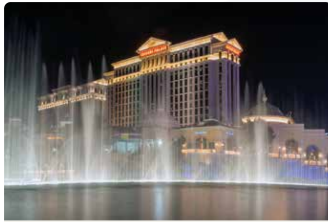
Fuente del Hotel Bellagio

Día libre para disfrutar de la capital mundial del entretenimiento con múltiples espectáculos de todos los estilos en los distintos hoteles y casinos del "Strip". Alojamiento.