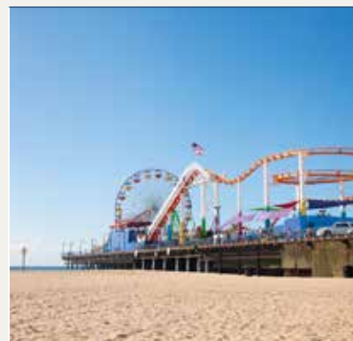
Santa Monica Pier