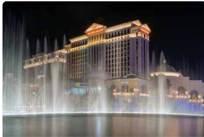
Fuente del Hotel Bellagio

Día libre para disfrutar de la capital mundial del entretenimiento con múltiples espectáculos de todos los estilos en los distintos hoteles y casinos del "Strip". Alojamiento.